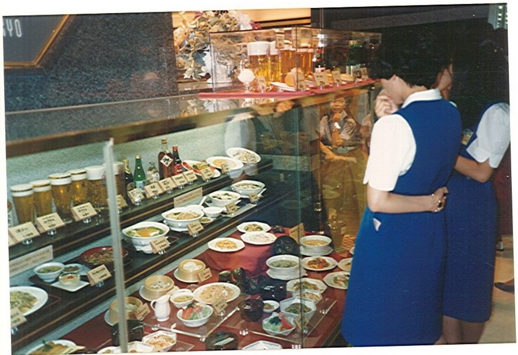
Uetirine di ristoranti all'interno dell'aeroporto di Tokio-Narita