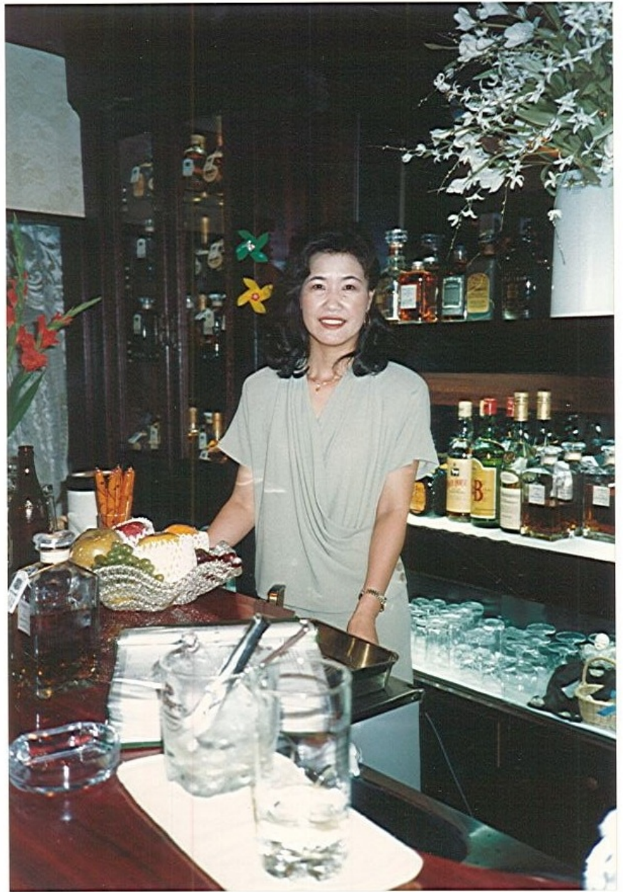
interio di Karaoke bar