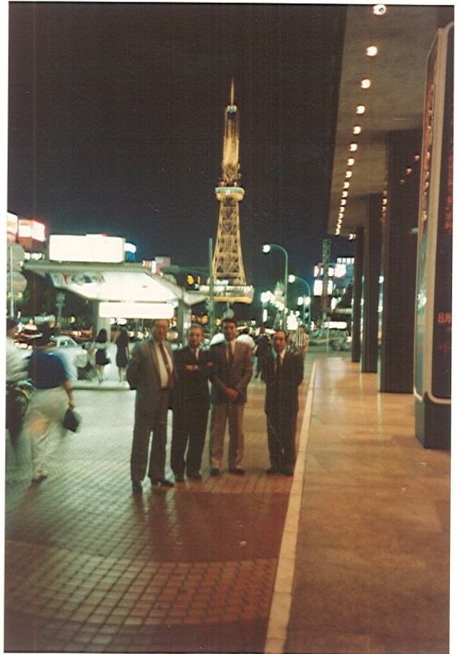
Nagoya: Sullo sfondo, la copia in scala 1/2 della Tour Eiffel