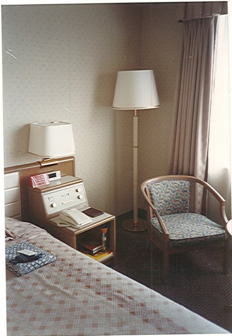
Nagoya Tokyu Hotel: Camera 1320